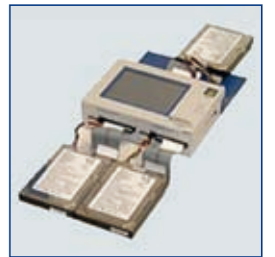
ハードディスクの複製（保全） ImageMASter Solo3 Forensic